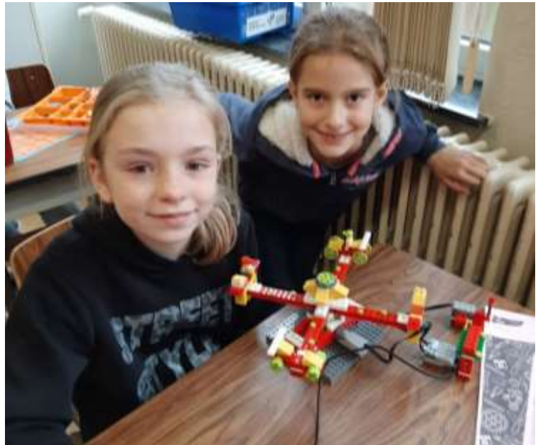
Kundabuffi's klanksprookjes voor de leerlingen van het 4 de leerjaar